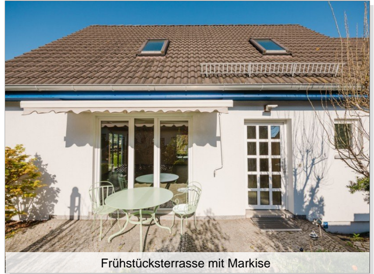
Frühstücksterrasse mit Markise