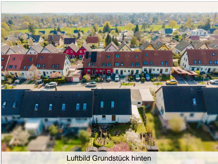
Luftbild Grundstück hinten