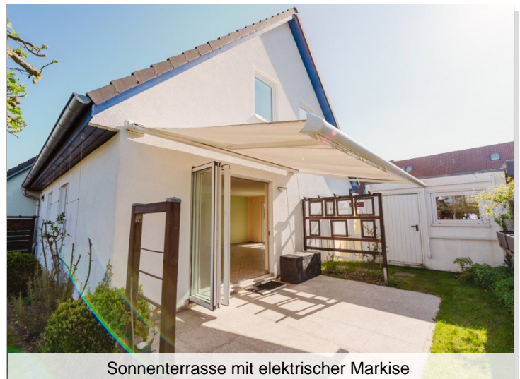
Sonnenterrasse mit elektrischer Markise