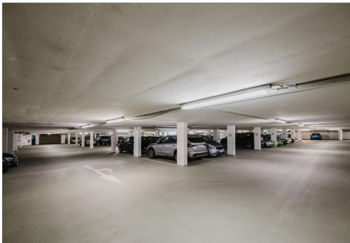
Tiefgarage mit Stellplatz